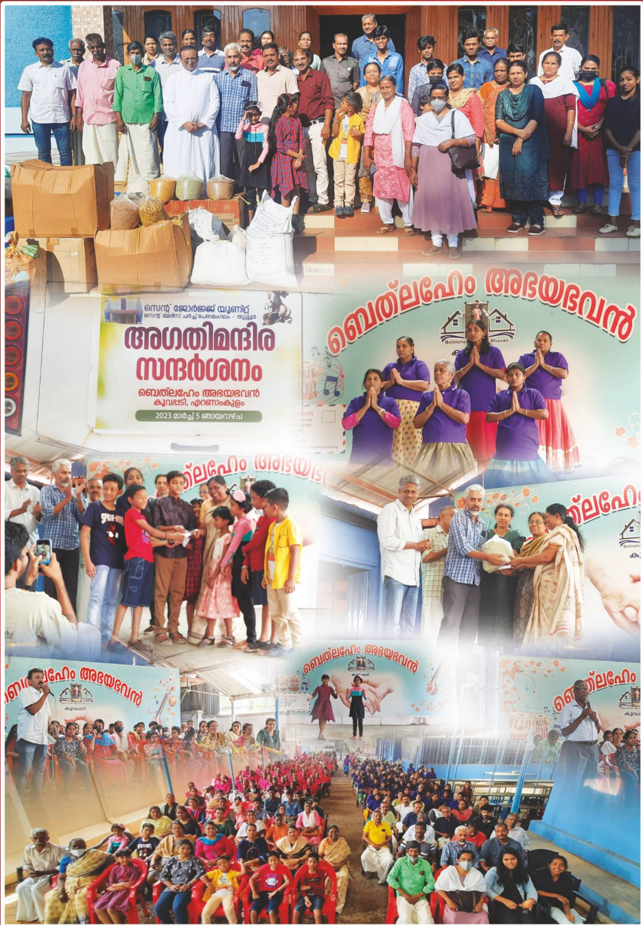
സെന്റ് ജോർജ്ജ് യൂണിറ്റിന്റെ നേതൃത്വത്തിൽ നാനൂറിൽപരം അന്തോവാസികളുള്ള ബെത്ലഹേം അഭയഭവനിലേക്ക് (കുവണ്ടി, എറണാകുളം) ഒരു ലക്ഷം രൂപയോളം വില വരുന്ന നിത്യോപയോഗ സാധനങ്ങളുമായി നോമ്പുകാല പരിത്രാഗ സന്ദർശനം നടത്തിയപ്പോൾ