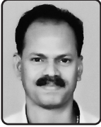
അക്രയ്യൂർബർഖി ഡേവിസ് കൊളമ്പ്രത്ത്